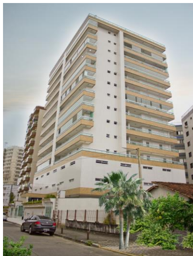
TABELA DE UNIDADES PRONTAS PARA MORAR